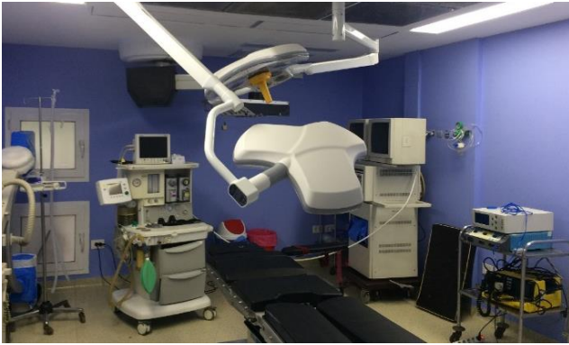
غرفة العمليات الجديدة بمستشفى النيل بدراوي