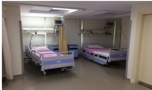
جناح وحدة العناية المركزة المجدد حديثًا في مستشفى النيل بدراوي