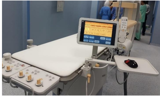
وحدة الفحوصات التداخلية بأشعة إكس بتكنولوجيا فيليبس العالمية في مستشفى كليوباترا